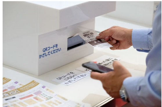
事前登録セルフ受付