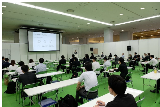
AI 技術利用に関するセミナー