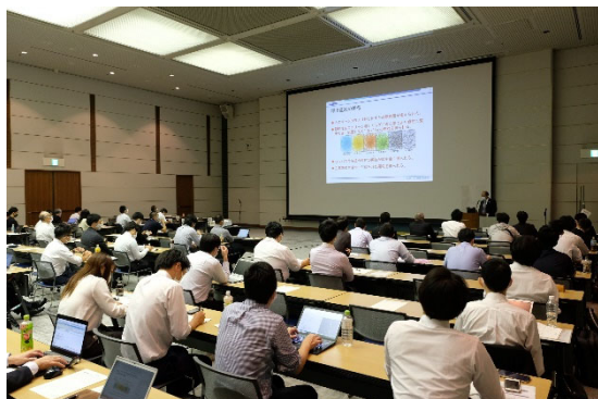
機器ガイダンス 造粒技術