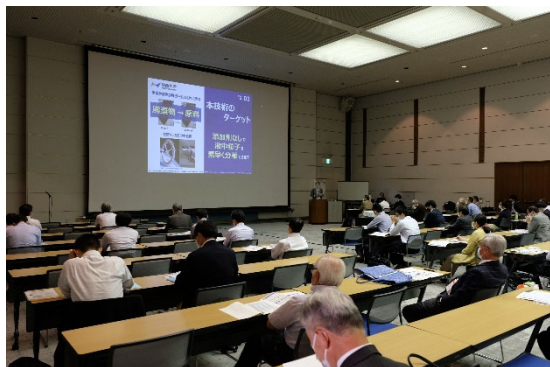
APPIE 産学官連携フェア&テクノプラザ