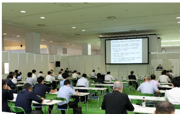
粉じん爆発情報セミナー