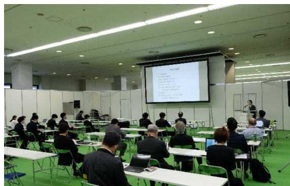
粉工展ガイダンス