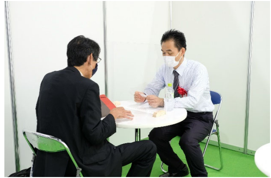
こなもん ことはじめ 名刺交換会