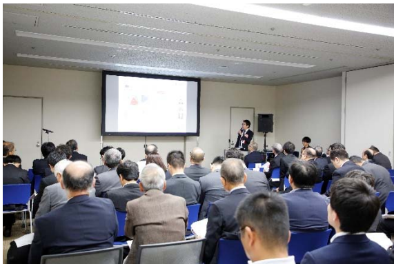
第9回海外情報セミナー