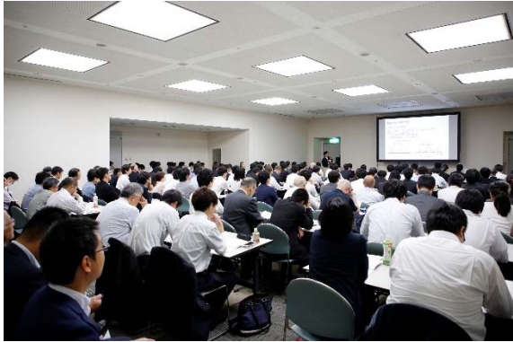
粉体機器ガイドス 乾燥