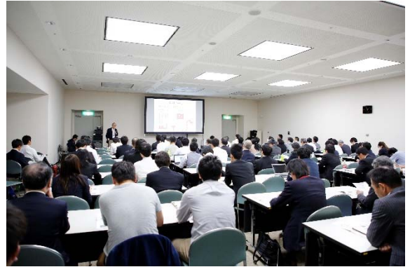
最新情報フォーラム 製造業における粉体シミュレーションの活用